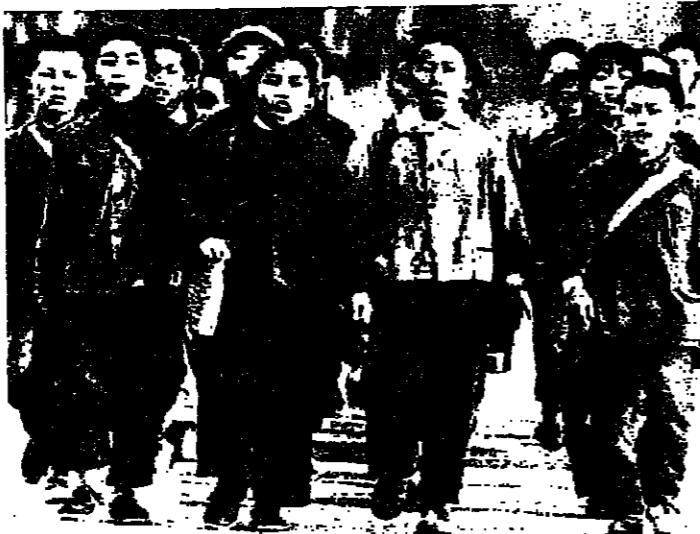
طلاب صفار « بطنين » ضدالحب